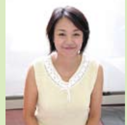
女性のためのカウンセラー